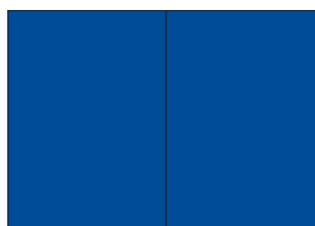
2/1 Seiten Panorama